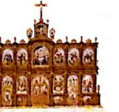
Άγνωστη αριστοτέλεια, καθώς και κρήνη αφρική σενά δε μένα με το πρώτο ναυ στην Ελλάδα, στην Ευρώπη και στην Αμερική, συνδέ τους Ένα εισιτικό πρόνομη της νεοελληνικής Ορθόδοξης Διακρορικής στο Αιγαίο του Βυζαντινού Πατριαρχείου της Θεσσαλονίκης. Το μοναδικό έργο στην μέση «ΤΕΜΠΛΑΘΝ - Αρχι Μορφές», πόρτες πλάτες πίστες, 200ς και 21ος σιωπας θα εγκλιματιστεί (27/10) ο Πρόεδρος της Δημοκρατίας Προκόπιος Παυλουπούλος. Σελ. 15