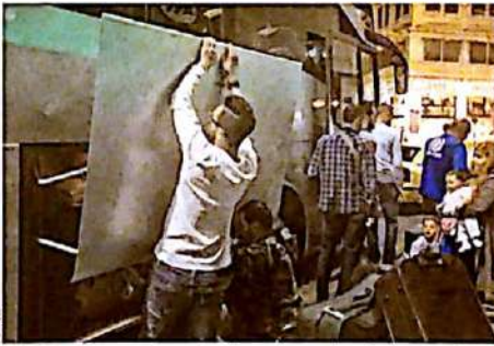
Πρώτη φορά στην Ομόνοια, χτες, τέσσερις Λεωφόροι παράλληλα 234 πρόσφυγες, 132 ενήλικες και 102 παιδιά, με προορισμό το προεδρείο, από όπου θα τοξίδουν προς μεταγκατάσταση στη Γαλλία. Κάποια από τους εμπόδες περιμένουν επί δυο χρόνια αυτή τη στιγμή. Σελ. 7